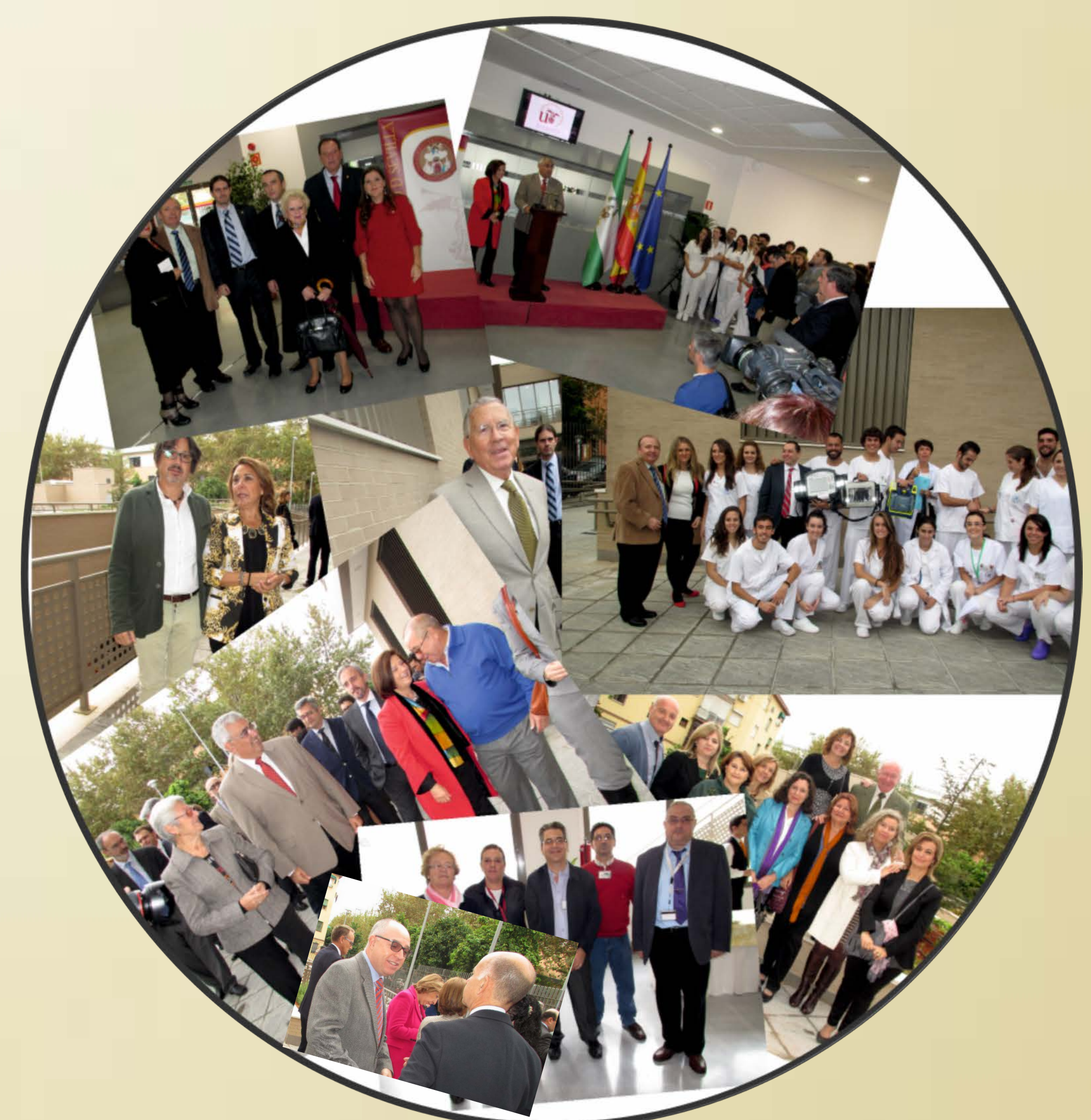
IMAGEN 7.2, F