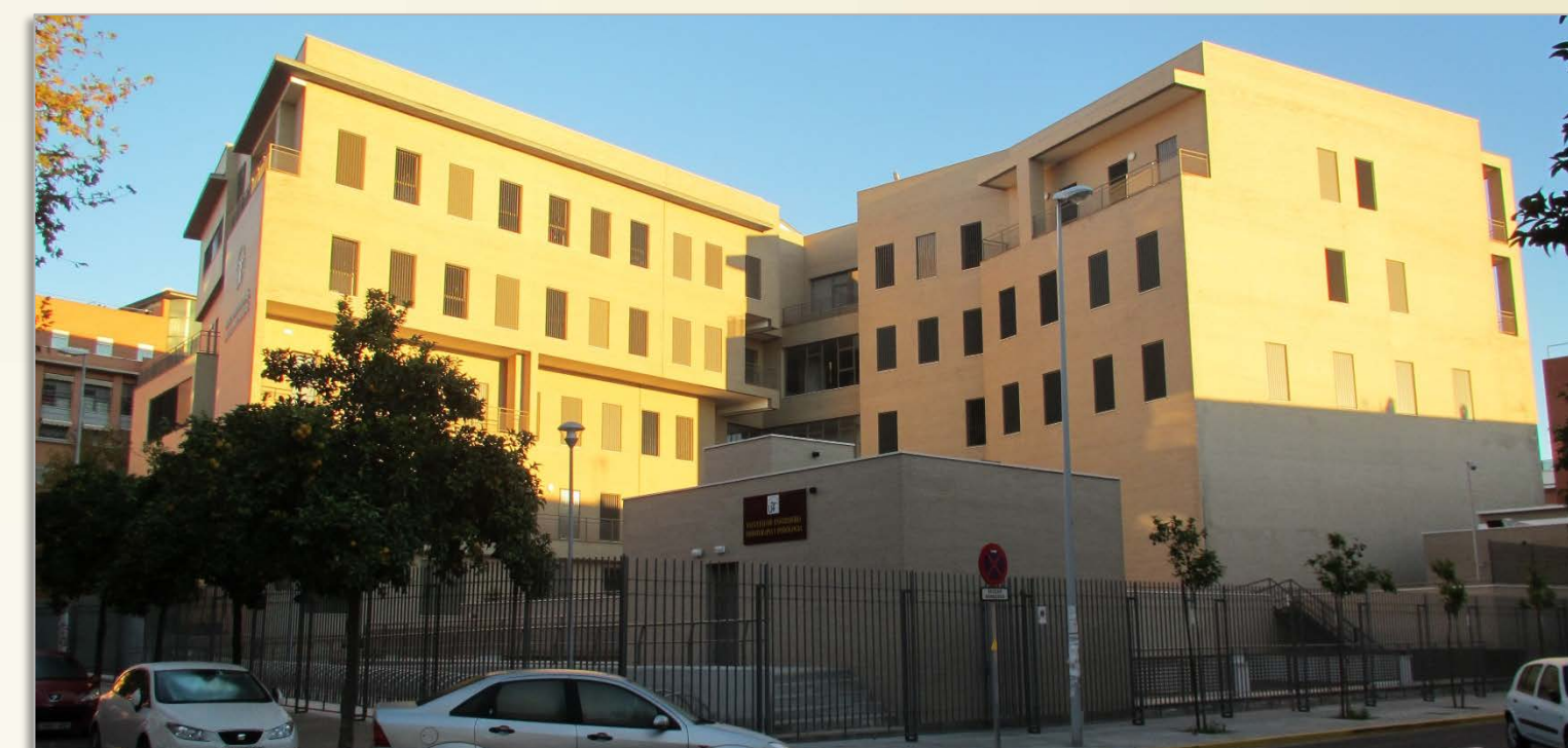
IMAGEN 7.2, B