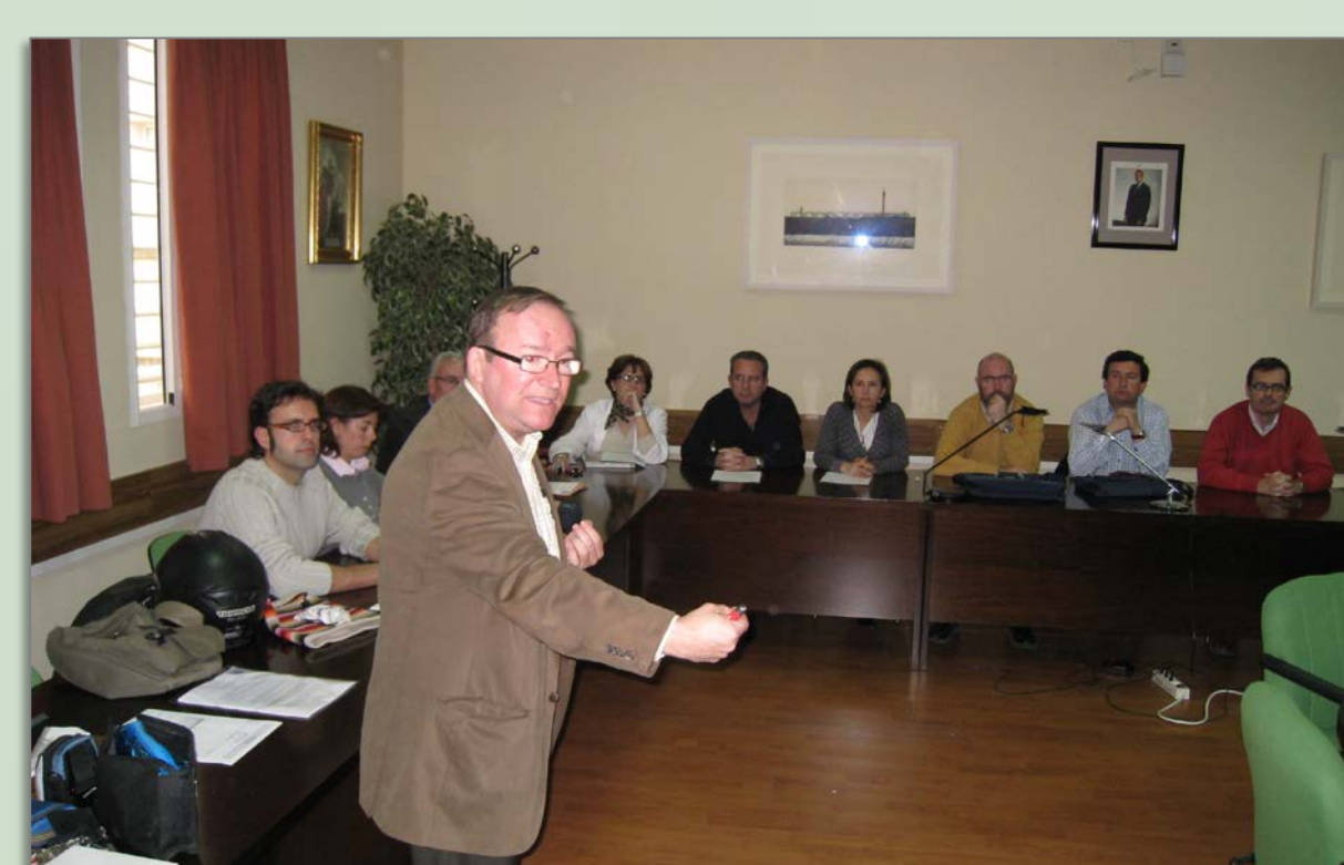
IMAGEN 7.3, A, B, . Las escuelas universitarias de Enfermería sevillanas (Macarena, Valme, Virgen del Rocío), Francisco Maldonado (Osuna), San Juan de Dios (Bormujos), y Cruz Roja celebraron durante el mes de junio de 2013 las ceremonias solemnes de graduación de la I Promoción de Grado en Enfermería 2009/13 ( Colección particular. Híades. Revista de Historia de la Enfermería )