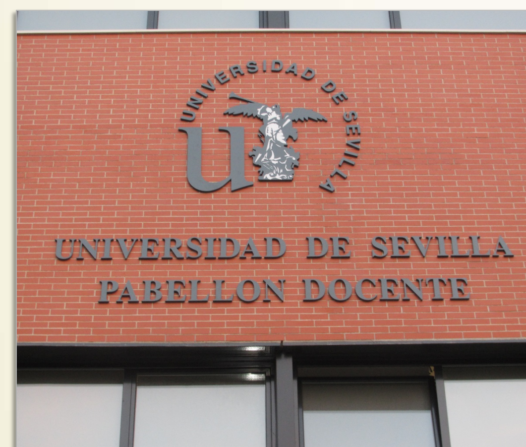
IMAGEN 7.3, A