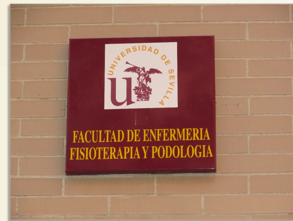
IMAGEN 7.2, A