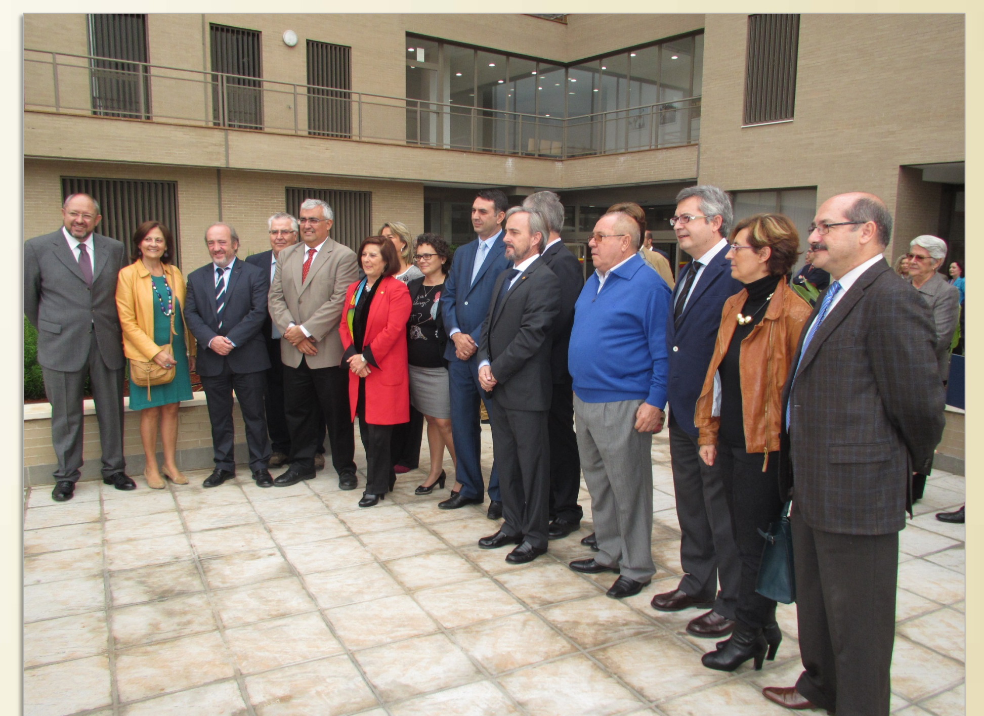
IMAGEN 7.2, E

IMAGEN 7.2, A, B, C, D, E, F. Inauguración del nuevo edificio de la Facultad de Enfermería, Fisioterapia y Podología de la Universidad de Sevilla, el 8 de noviembre de 2014. Asimismo se inauguran en 2014 pabellones docentes de la Universidad de Sevilla