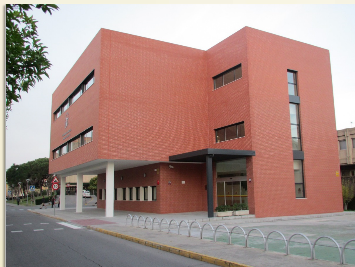
IMAGEN 7.2, B

IMAGEN 7.3, A, B, . Las escuelas universitarias de Enfermería sevillanas (Macarena, Valme, Virgen del Rocío), Francisco Maldonado (Osuna), San Juan de Dios (Bormujos), y Cruz Roja celebraron durante el mes de junio de 2013 las ceremonias solemnes de graduación de la I Promoción de Grado en Enfermería 2009/13