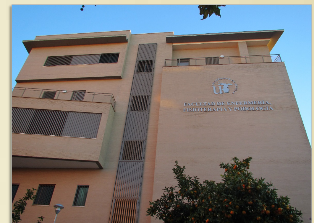
IMAGEN 7.2, C

IMAGEN 7.2, A, B, C, D, E, F. Inauguración del nuevo edificio de la Facultad de Enfermería, Fisioterapia y Podología de la Universidad de Sevilla, el 8 de noviembre de 2014. Asimismo se inauguran en 2014 pabellones docentes de la Universidad de Sevilla