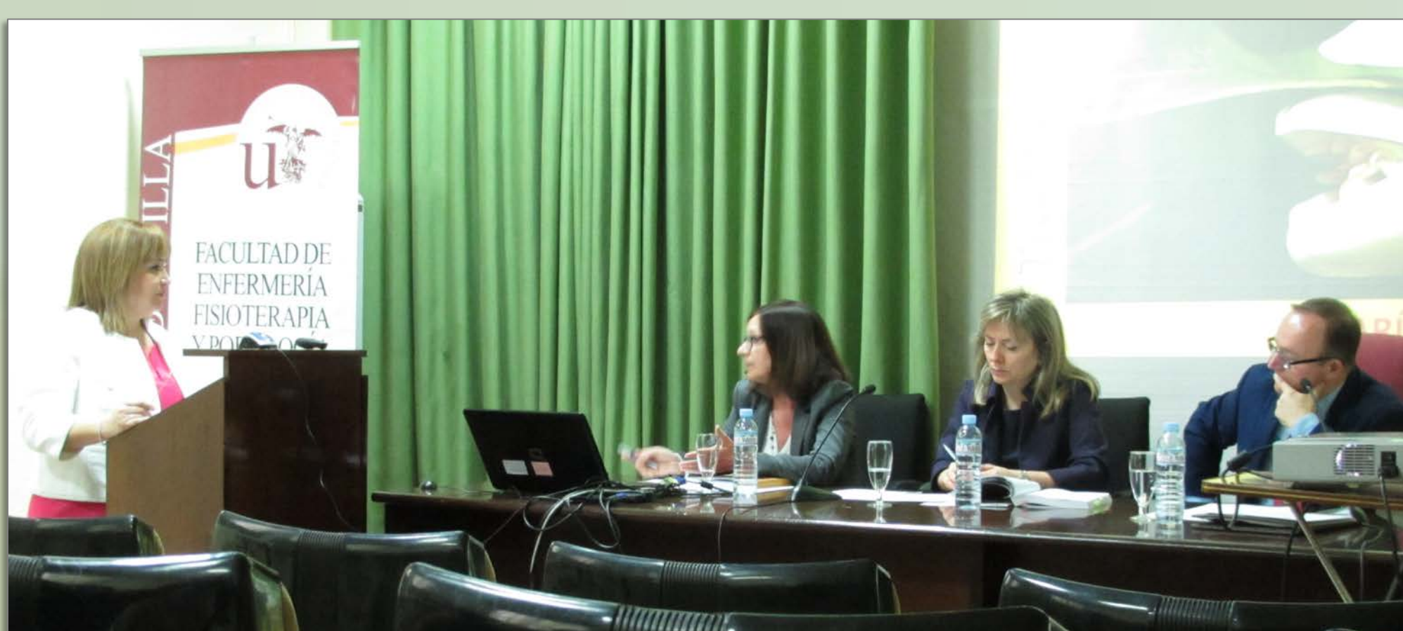
IMAGEN 7.4, A, B, . Defensas de Tesis Doctorales e impartición del Máster Oficial de Enfermería